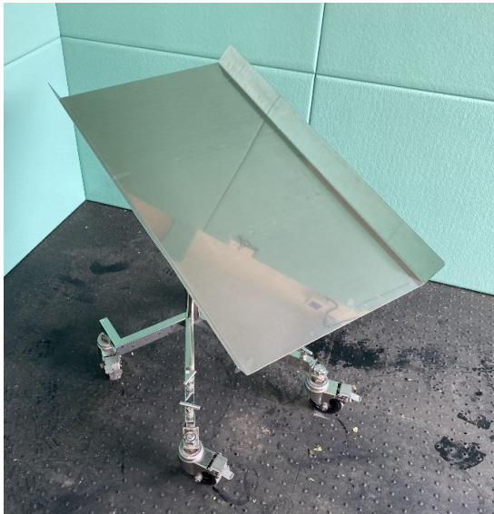
コロンテーブル(オプション) ステンレス製です。 台のサイズ:W474mm × D800mm 高さの調節が可能のため、 本体に合わせてご使用ください。