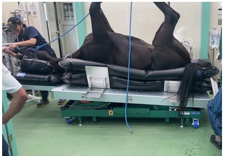
実際に手術台を使用して手術をしている風景です。