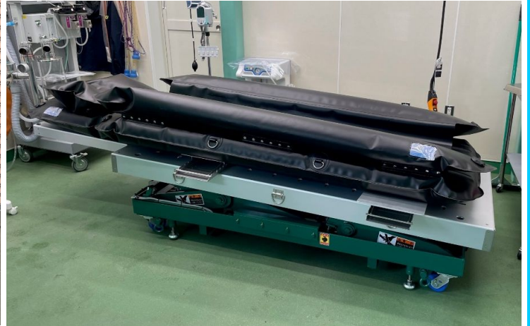
リフター上のマットが、海外輸入のオプションです。 マットを使用することで、より安定した体勢で手術を行えます。