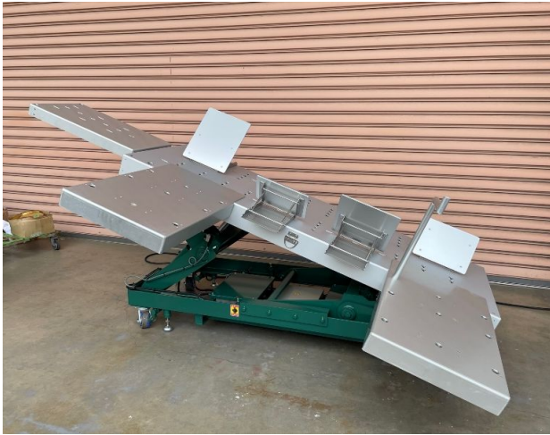
リフターを最大まで傾けた際の傾斜です。